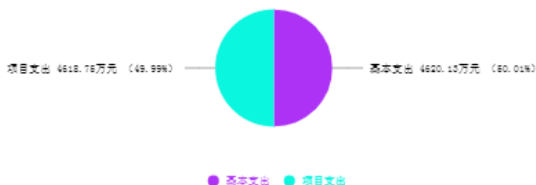
支出预算总体结构图