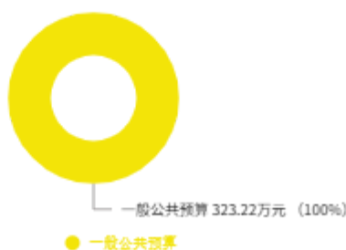
本年收入预算结构图

延津县特殊教育学校2025年收入合计323.22万元，其中：一般公共预算276.11万元；政府性基金预算0万元；国有资本经营预算0万元；财政专户管理资金收入0万元；事业收入0万元；事业单位经营收入0万元；上级补助收入0万元；附属单位上缴收入0万元；其他收入0万元；上年结转结余47.11万元。